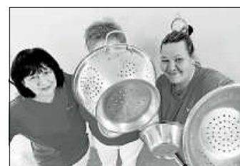
Präsenzkräfte vom Wohnbereich Burggärtle

Was wäre die Welt ohne Hauswirtschaft? Ohne diese Mitarbeiter wäre vieles gar nicht möglich. Am Tag der Hauswirtschaft wollen wir uns bei allen Mitarbeitern für ihre tolle Arbeit bedanken, und daran erinnern, wie wichtig und wertvoll diese Berufsgruppe für uns alle ist. Unsere Mitarbeiterinnen hatten an diesem Tag viel Spaß beim Fotoshooting im Haus Kastanienblüte.