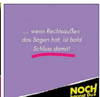
Plakate: AK Asyl