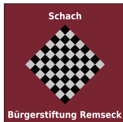
Logo: Gerald Winkler

Diesen Grundsätzen kann sich die Schachgruppe der Bürgerstiftung nur anschließen. Wir setzen auf die integrative Kraft des Sports, die Gemeinschaft ist uns wichtig. In unseren Schachabenden sind neue Interessenten für das königliche Spiel gerne willkommen. Wir treffen uns wieder am Montag, 8. April um 19 Uhr im Haus der Bürger in Aldingen.