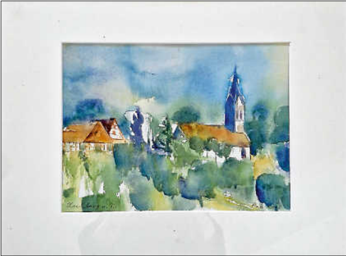
„Hochberg a.N.“ von Sigrid Plate