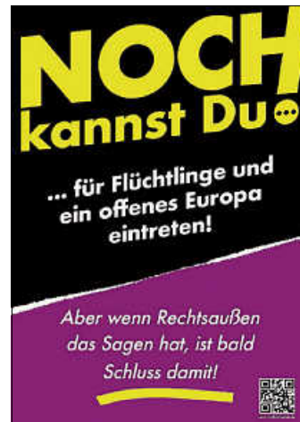
Plakat: AK Asyl / Stiftung gegen Rassismus

Und nicht nur damit! - Sie wollen mehr erfahren? https://stiftung-gegen-rassismus.de/ Nächstes offenes Treffen der AK-Asyl-Unterstützenden: 17. 04. 2024, 18.30 Uhr Offen für alle Interessierten. Seien Sie dabei.