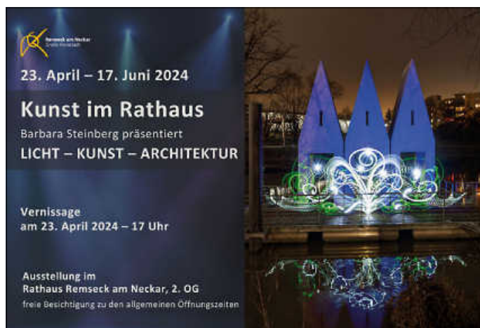
Plakat: Stadtverwaltung Remseck am Neckar, Foto: Barbara Steinberg

Vom 23.04. bis 17.06.2024 kann die Ausstellung zu den allgemeinen Öffnungszeiten des Rathauses im 2. OG besucht werden. Wir freuen uns auf Ihr Kommen!