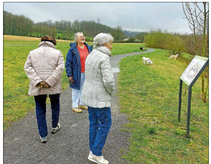
Infotafeln werden immer sehr gerne gelesen