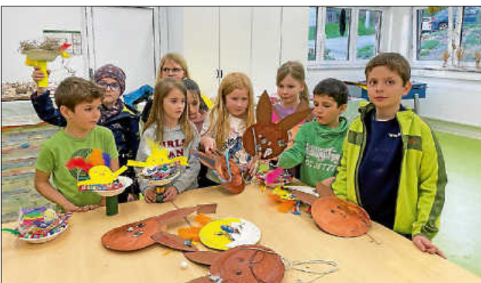
Gruppe der Grundschulkinder

Am vergangenen Samstag war richtig was los in der Hobbybude. Zuerst kamen die Kindergartenkinder mit Mamas, Papas oder Freunden, die sie tatkräftig unterstützten. Danach die Grundschulkinder. Ausgestattet mit allerlei Bastelmaterialien, Pinsel, Schere u.s.w. ging es gleich ans Werk. Küken, Eier, Hasen oder gleich alles nacheinander, es wurde hochmotiviert und mit viel Spaß gebastelt. Zum Abschluss wurden die hergestellten Nestchen und Täschen noch mit leckeren Osternaschen gefüllt. Schön, dass ihr da ward, ihr habt das alle ganz toll gemacht!