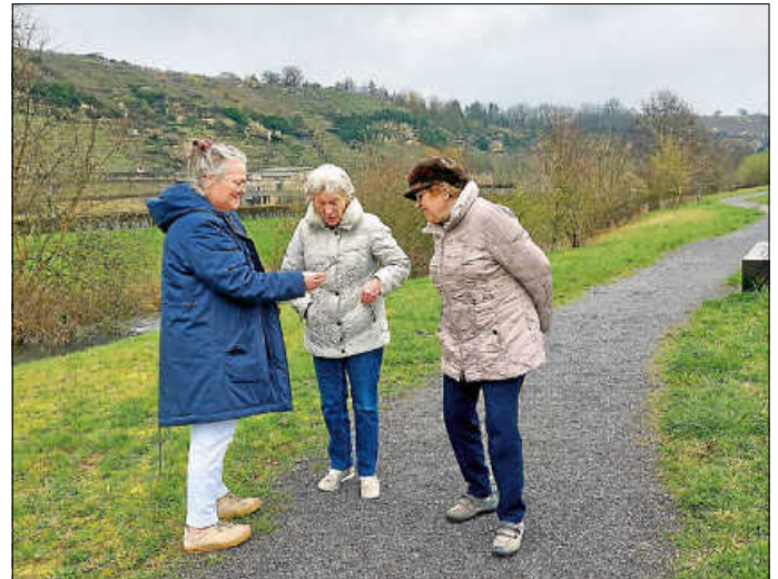
Bewohner und Mitarbeiterin auf Entdeckungstour

Es gibt viel zu entdecken in unserer schönen Heimat. Bei einem Spaziergang am Neckar wurde wieder viel Interessantes entdeckt, und die frische Luft tut immer allen gut. Jetzt sind alle gespannt, wie weit sich die Natur im Frühling fast täglich verändert.