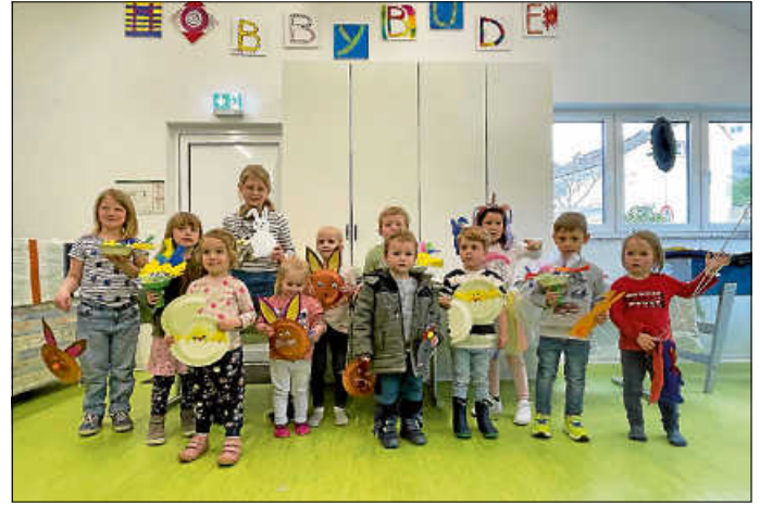
Gruppe der Kindergartenkinder (mit Geschwistern)