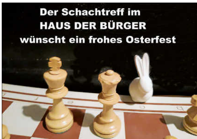
Grafik: Manfred Hermann