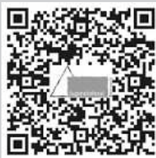
QR-Code: Jugendreferat Remseck