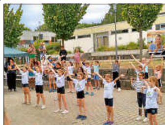
Auftritt Zumba AG

Danach begeisterte die Besucher der Auftritt der Zumba AG, die mit schwungvollen Rhythmen zum Mitmachen animierte. Der Eismann sorgte trotz des zwischenzeitlichen Regenschauers für eine willkommene Abkühlung bis zum Auftritt des Clowns, der mit seinen Luftballon-Modellierkünsten für strahlende Gesichter sorgte.