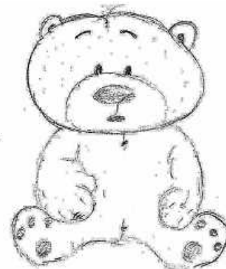
Grafik: Haus der Bürger

Der „Offene Treff“ für Kinder bis 3 Jahre und Erwachsene soll wiederbelebt werden. Wer hat Interesse einmal in der Woche zu helfen und würde die Gruppe ehrenamtlich führen? Wir haben im Haus der Bürger, kostenfreie Räume, Spielzeug und eine gute Kaffeemaschine.