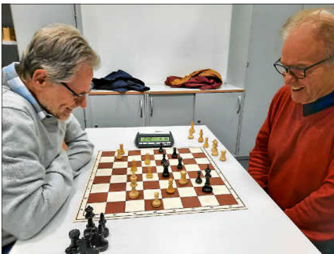
Beim Blitzschach bleibt wenig Zeit, über den nächsten Zug nachzudenken