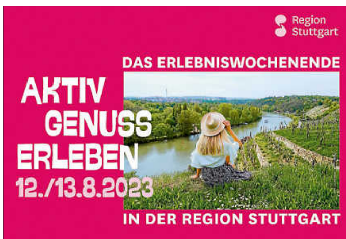
Plakat: Stuttgart-Marketing GmbH

Mit Genuss die Region entdecken! Am 12. und 13. August 2023 laden 25 Kommunen der Region Stuttgart Sie herzlich dazu ein, Ihre Region (noch) besser kennenzulernen! Haben Sie Lust auf eine Stadtführung oder eine Kutschfahrt? Oder lieber raus in die Natur und wandern? Die Angebote sind vielfältig und für jeden Geschmack ist etwas dabei – und das wortwörtlich! Denn jeder Ausflug dreht sich um das Thema Genuss. Die Spezialitäten der Region, ob Wein, Gebäck, Kaffee oder Konfitüre, begleiten Sie auf