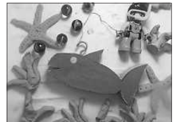
...zum fertigen Filmchen.