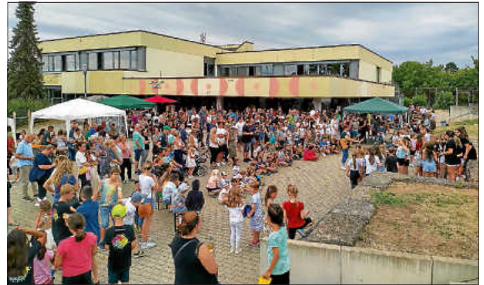
Besucher des Sommerfest

Vorstandsteam - Förderverein der Grundschule Hochberg e.V.