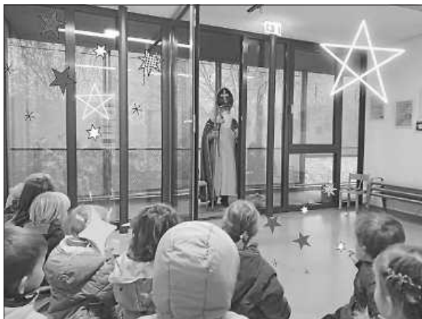
Bischof Nikolaus zu Besuch in der Kita

Zu Beginn der Adventszeit erreichte die Kita St. Martin ein Brief von Bischof Nikolaus. Darin versprach er, auch dieses Jahr am 6. Dezember die Kinder zu besuchen und bat sie, doch Socken mitzubringen. Vielleicht würde er diese gefüllt am Nikolaustag mitbringen. Alle Kinder brachten fleißig Socken mit. Und eines Morgens waren sie tatsächlich verschwunden! Verwundertes und aufgeregtes Getuschel ging durch die Reihen der Kleinen. Wann hatte Bischof Nikolaus sie abgeholt? Und würde er sie mit Geschenken befüllt zurückbringen?