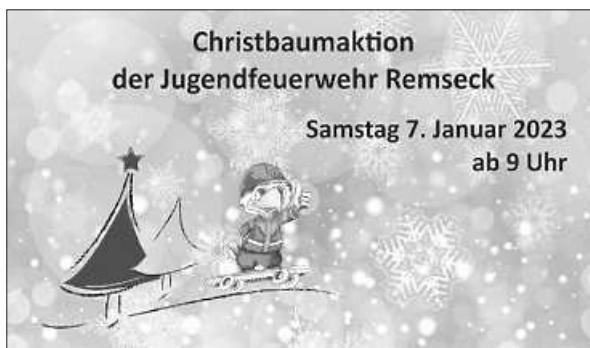
Plakat: Feuerwehr Remseck