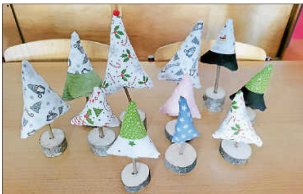
Ergebnis aus dem Näh-Workshop

Was passt besser zur Weihnachtszeit als selbst gebackene Gutsle und handgemachte Geschenke? Das dachten sich die Teilnehmer unserer bisherigen Workshops auch und haben fleißig gewerkelt. Und so entstanden im Nähworkshop kleine Tannenbäume und am Back-Workshop zog ein leckerer Duft durch die Flure des Schulhauses.