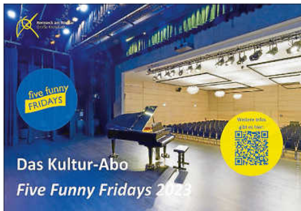
Plakat: Stadt Remseck am Neckar

Wir freuen uns darauf, viele altbekannte und neue Abonnentinnen und Abonnenten in der Stadthalle begrüßen zu dürfen!