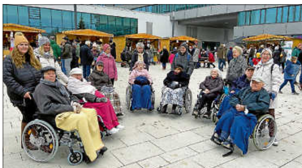
Ein Foto zur Erinnerung an den schönen Ausflug zum Weihnachtsmarkt

Ehrenamt ist nicht alles, aber ohne Menschen, die sich ehrenamtlich einsetzen, wäre vieles nicht möglich !