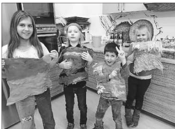
Kinderfilzen in der Hobbybude

Die Weihnachtsvorbereitungen laufen und so fand am Nikolaus-tag in der Bude ein Kinderfilzkurs statt, bei dem die Kinder eigene Geschenke herstellen konnten. Aus weicher Schafswolle, warmen Wasser und duftender Seife wurden die schönsten Filzwerke in der Nassfilztechnik gestaltet. Dieses Mal entstand eine gefilzte Fläche, die als Sitzaufgabe, Untersetzer, Tischset oder Wandbild zum Einsatz kommen kann. Die Kinder hatten viel Spaß und wir hoffen, dass das gefilzte Geschenk viel Freude macht.