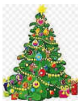
Grafik: Haus der Bürger