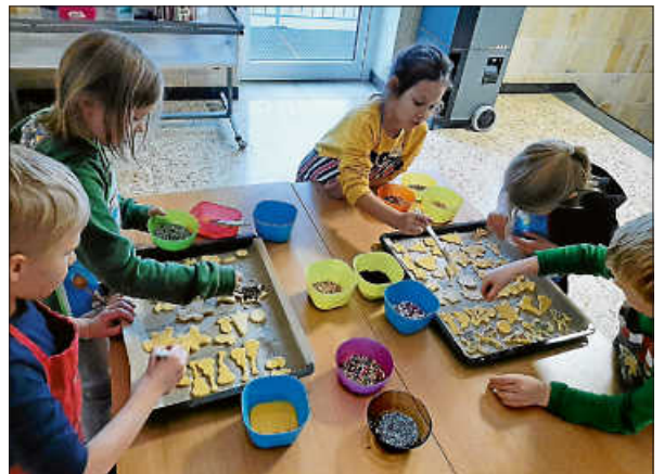
... und verzieren