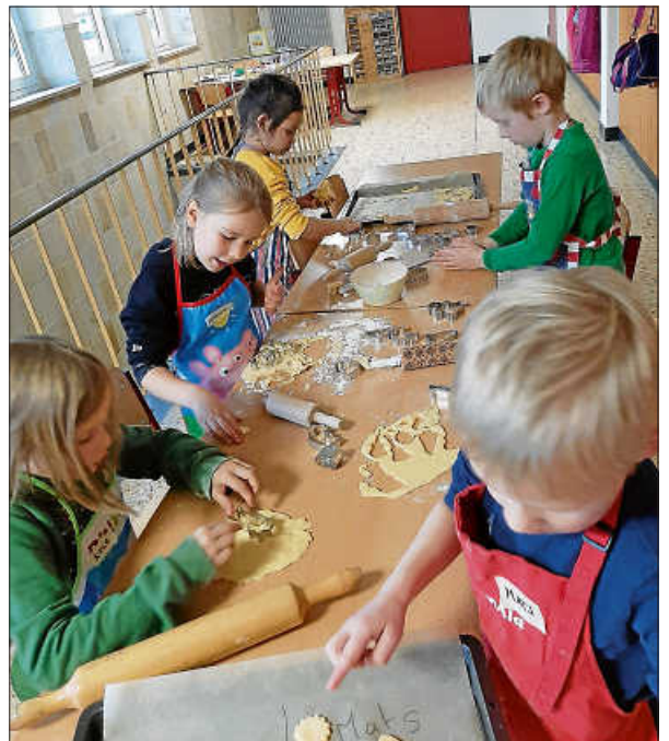
Fleißig am backen...

Der Förderverein wünscht frohe Feiertage und einen guten Start in das neue Jahr!