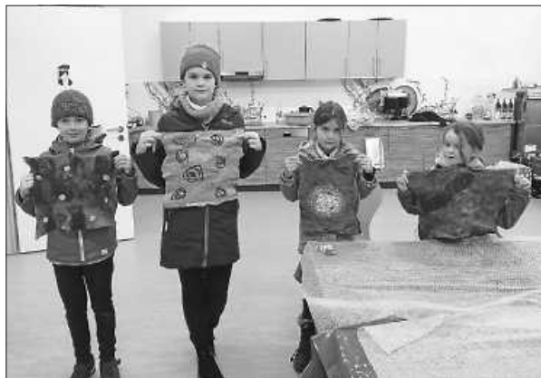
Eigene Geschenke, selbst gefilzt

Wir wünschen eine schöne Vorweihnachtszeit! Euer Team der Hobbybude