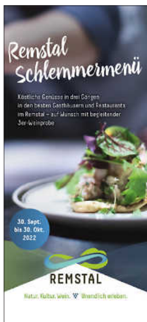
Plakat: Remstal Tourismus e. V.