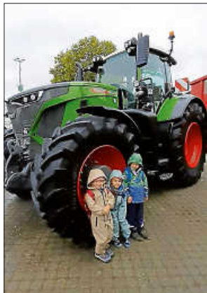
Ein Teil der Neckargröninger Watomis vor einem riesigen Schlepper

Beim Stand der Jäger sahen wir viele ausgestopfte heimische Wildtiere und durften die verschiedenen Felle auch fühlen. Auf einem Wildschwein durften sogar alle Kinder mal drauf sitzen.