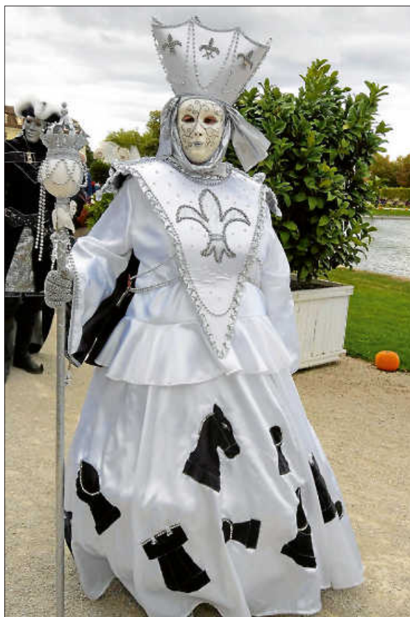
Das königliche Spiel war auf der Venezianischen Messe in Ludwigsburg ein fotogenes Motiv