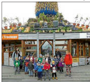
Die Hochdorfer Watomis vor der Fruchtssäule

Ein Landwirtschaftsfest? Mit vielen Tieren, Maschinen und Traktoren? Da wollten wir unbedingt dabei sein!