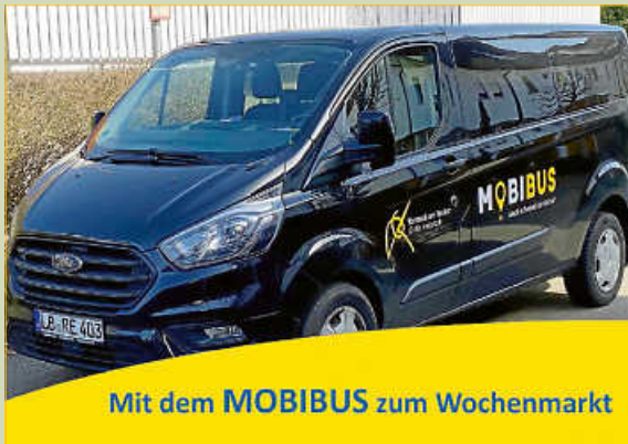
Mit dem MOBIBUS zum Wochenmarkt

Der MOBIBUS ermöglicht Remsecker Senioren, Familien und Bürgerinnen und Bürgern mit kognitiven und/oder körperlichen Einschränkungen mehr Mobilität im Stadtgebiet.