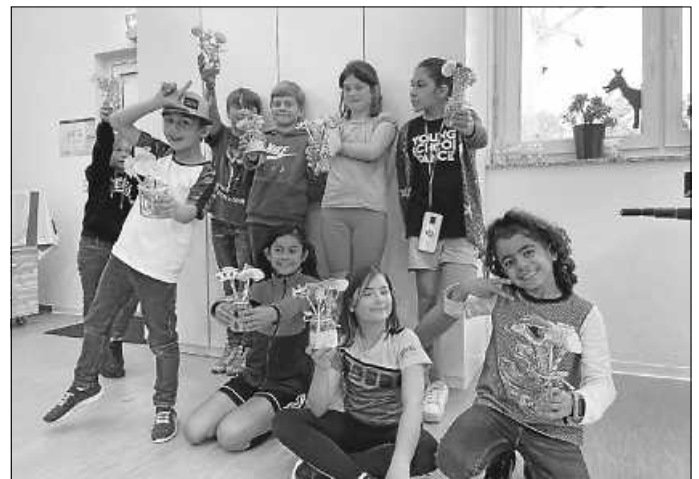
Muttertagsbasteln in der Hobbybude

Am vergangenen Mittwoch haben wir uns in der Bude zum mittlerweile traditionellen Muttertagsbasteln getroffen. Dieses Jahr haben wir Blumensträuße aus Papier gestaltet. Ein Strauß der extra lange hält und nicht welken kann! Dazu individuell gestaltete Karten mit ein paar lieben Worten an Eure Mamas. Das habt Ihr alle richtig super gemacht und es war wie immer ein lustiger, toller Nachmittag. Ein extra großes Dankeschön geht an Britta!