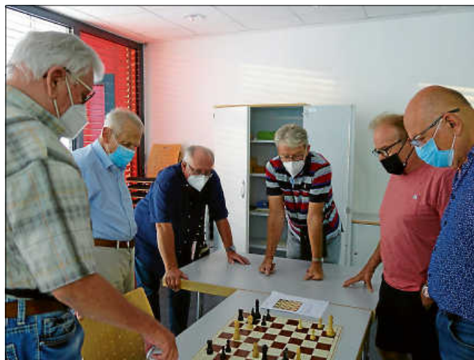
Die Schachaufgabe wird gemeinsam gelöst

Da der November insgesamt fünf Montage hat, kann der zweiwöchige Abstand zwischen den Schachabenden gut eingehalten werden. Dies bedeutet, dass sich die Schachgruppe danach am 22. November wieder treffen kann. An diesen zweiten Novembertermin werden wir nochmals rechtzeitig erinnern. Generell gilt, dass Gäste stets willkommen sind. Wer also wieder einmal eine Schachpartie spielen möchte, findet in der Schachgruppe sicher den zu seiner Spielstärke passenden Partner.