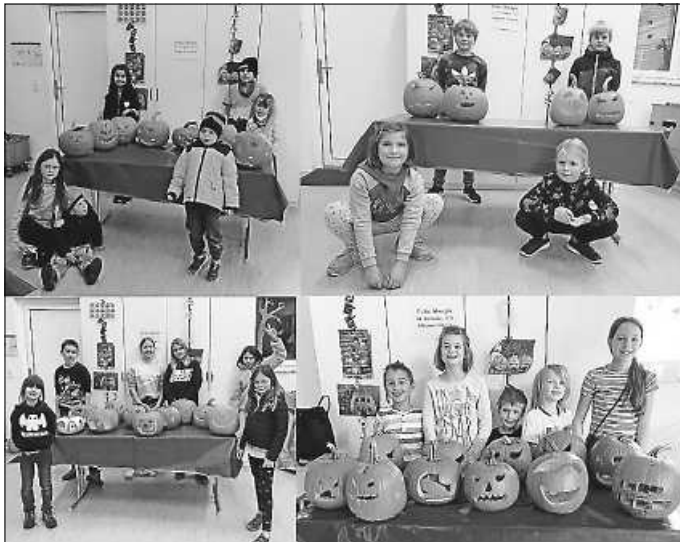
Kürbisschnitzen in der Hobbybude

Auch in diesem Jahr gab es wieder das traditionelle Kürbisschnitzen in der Hobbybude. Es wurde gesägt, geschnitzt, gebohrt und gehobelt... Nach Lust und Laune wurden schaurig-schöne und auch lustig-schiefe Kürbisgestalten geschaffen. Dabei waren insgesamt 23 Kinder mit einer Begleitperson in 4 Gruppen und gestalteten ihre einzigartige Kürbislaternen. Neben Gesichtern und Figuren entstanden auch mal kleine Häuser und sogar eine Katze! So manche/r Mutter, Tante, Vater und Opa waren begeistert bei der Sache! Mit einem einmalig schönen Kürbis unterm Arm gingen alle nach Hause. Halloween kann kommen!