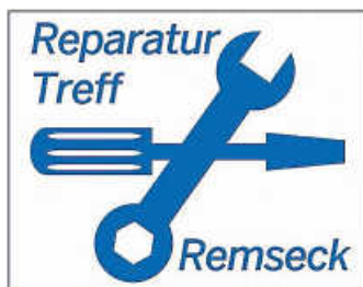
ReparaturTreff Grafik: Tauschbörse Remseck

Der ReparaturTreff der Tauschbörse bietet bis Ende November die Möglichkeit, Gegenstände (Elektronikartikel, kleinere Möbel, Fahrräder, Kleidung, etc.) zur Reparatur anzumelden. Wenn Sie von dieser Möglichkeit Gebrauch machen wollen, dann melden Sie sich bitte per E-Mail: schriftfuehrer@tauschboerse-remseck.de an mit Details zum reparaturbedürftigen Gegenstand. Die Anfragen werden entsprechend an die ehrenamtlichen Helfer weitergeleitet, welche sich dann bei Ihnen melden, um das weitere Vorgehen zu besprechen. Ein ReparaturTreff vor Ort findet in diesem Jahr nicht mehr statt.