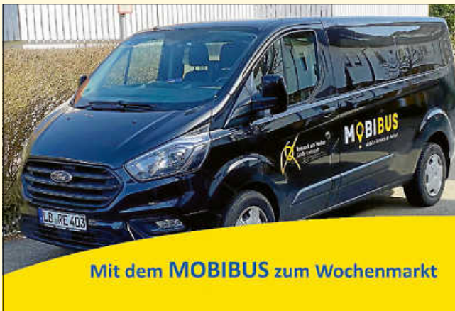
Mit dem MOBIBUS zum Wochenmarkt

Der MOBIBUS ermöglicht Remsecker Senioren, Familien und Bürgerinnen und Bürgern mit kognitiven und/oder körperlichen Einschränkungen mehr Mobilität im Stadtgebiet.