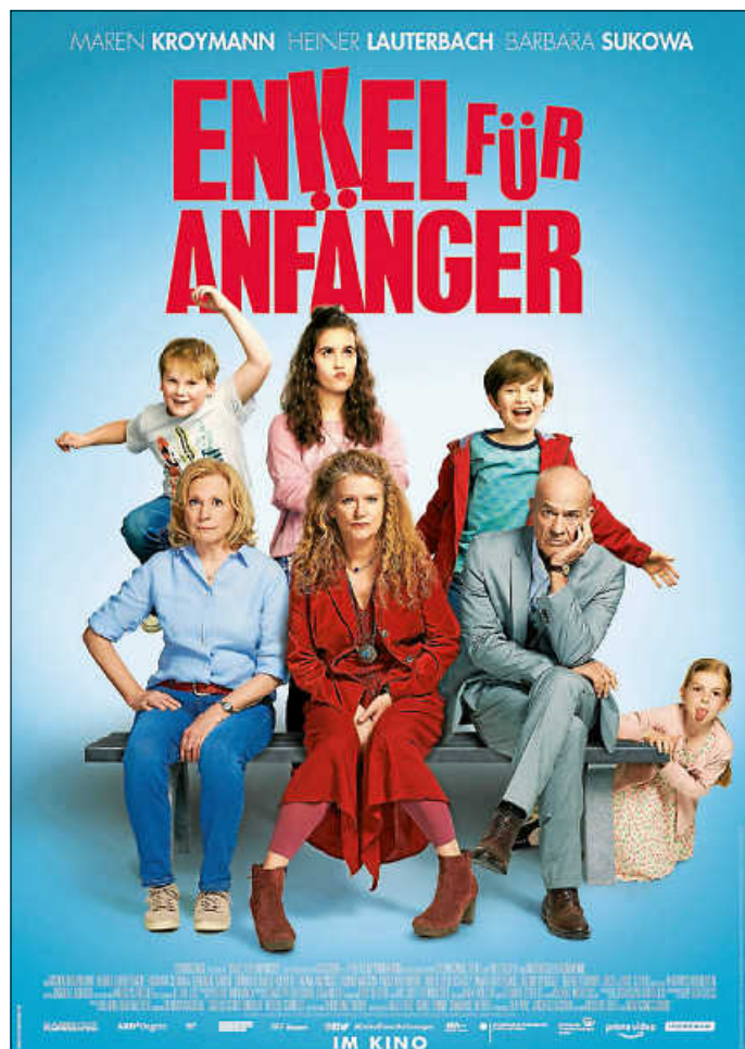
Enkel für Anfänger